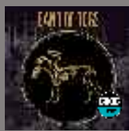
BAND OF DOGS