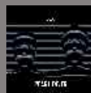
HIMIKO PEARL DIVER