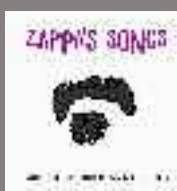
JIMI DROUILLARD ZAPPA'S SONGS